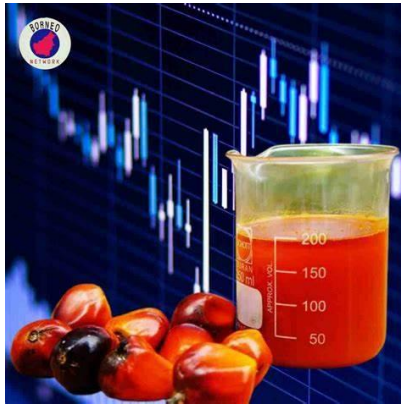
Gambar 5.2 Bentuk Minyak Kelapa Sawit