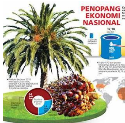
Gambar 5.1 Pohon Sawit dan Buah Sawit

Indonesia mengekspor minyak sawit mentah ke berbagai negara di dunia. Bab ini akan membahas pasar utama minyak sawit Indonesia, dinamika harga, serta perjanjian dagang yang berpengaruh terhadap ekspor minyak sawit mentah.